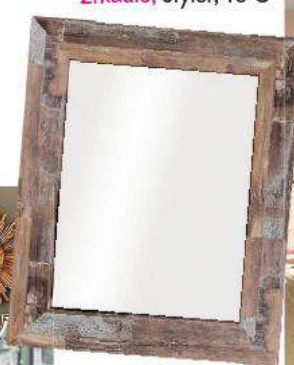
Zrkadlo, Styler, 76 €