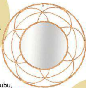
Zrkadlo, Mauro Feretti, 106 €