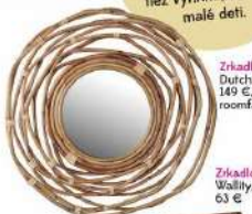
Zrkadlo, Dutchbone Kubu, 149 €, predáva roomfactory.sk

Sklenený nábytok by nemal byť na mieste, kde sa príliš vlní prach. Nábytku so zrkadlami sa tiež vyhňte, ak máte malé deti.