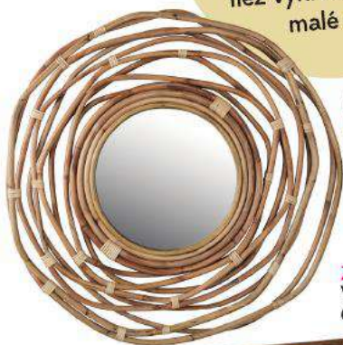
Zrkadlo, Dutchbone Kubu, 149 €, predáva roomfactory.sk

Sklenený nábytok by nemal byť na mieste, kde sa príliš víri prach. Nábytku so zrkadlami sa tiež vyhnete, ak máte malé deti.