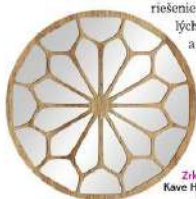
Zrkadlo, Styler, 49 €

Tento trik zaručí, že do vášho interiéru prenikne viac svetla. Je to jeden z najstarších dizajnerských trikov. Umiestnenie zrkadla oproti oknu totiž zabezpečí, že zrkadlo odrazí prísun prirodzeného denného svetla, a tým miestnosť krásne presvetlí a prevzdúšni. Toto riešenie je ideálne do malých obývačiek, chodieb a jedální.