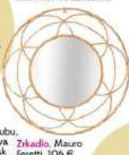
Zrkadlo, Mauro Foretti, 106 €