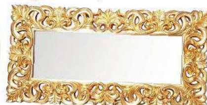
Zrkadlo, Veneto, 509 €, predáva Estilofina.sk

Vyskúšajte predelené štvorcové zrkadlo. V kúpeľni pôsobí nesmierne štýlovo.